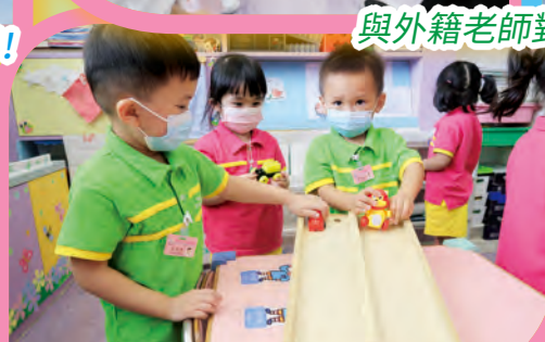
在斜板上，車子是怎樣走的？