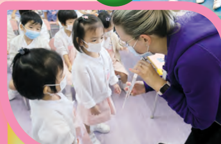
與外籍老師對話無難度