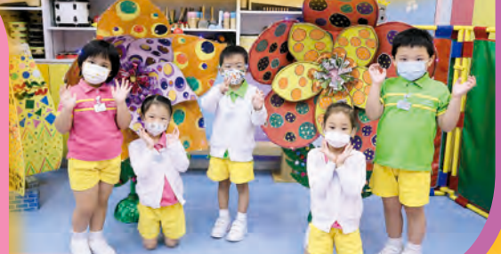
看! 我們的藝術花朵