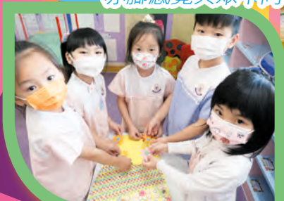
為新衣裳添上美麗圖案