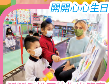
鬥鬥看誰更快指出答案！