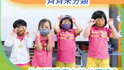
你知道我們在扮什麼嗎？