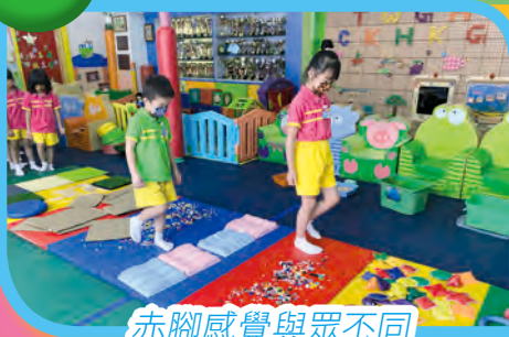
赤腳感覺與眾不同