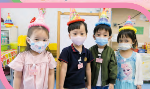
學校幫我們慶祝生日，好開心呀！