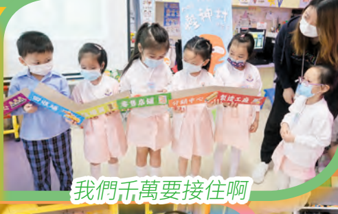
我們千萬要接住啊