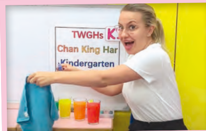
愉快學英語 (幼兒班)