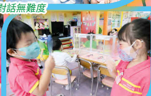
看！我改變了世界的色彩