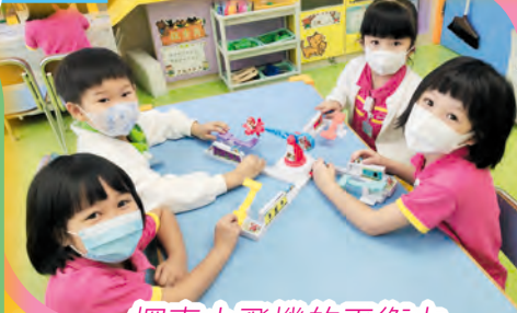
探索小飛機的平衡力