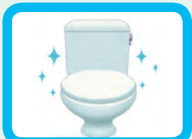
如廁後，蓋上廁板沖水