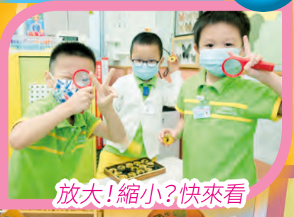
放大! 縮小? 快來看